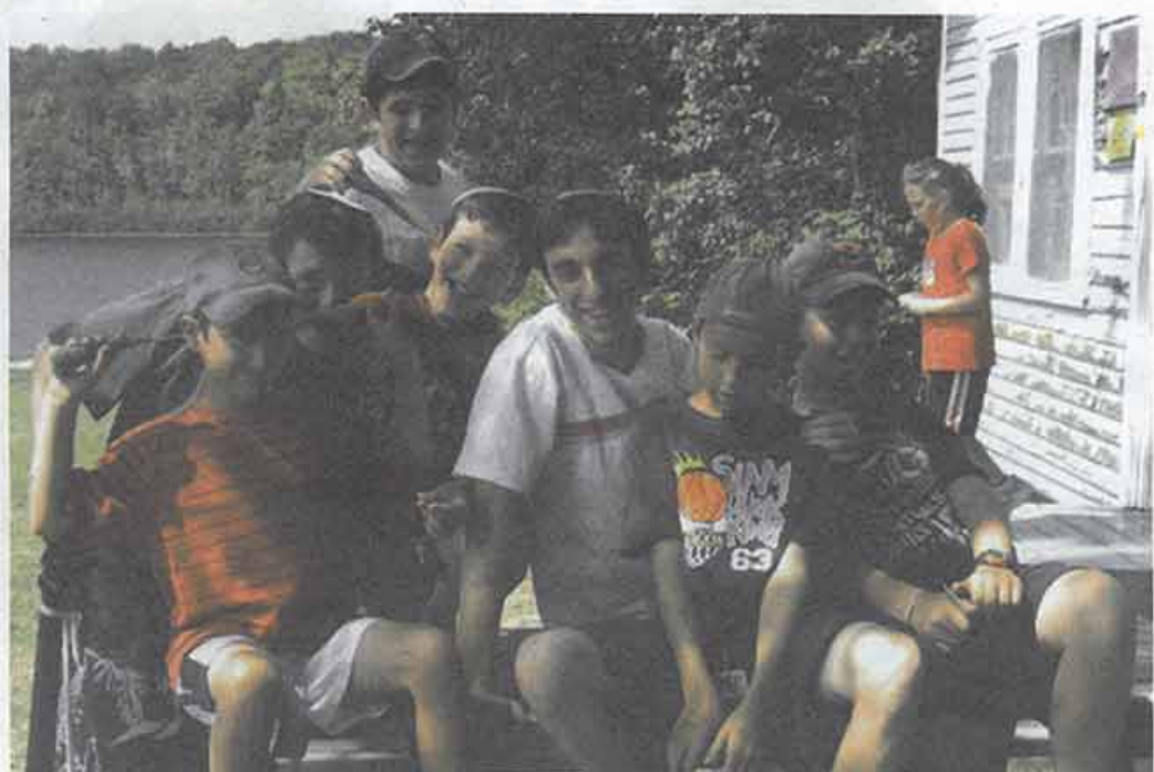
כולנו עם אחד. בני נוער אמריקאים וישראלים במחנה קיץ

"אחת המוטיבציות של ההורים האמריקאים להביא ישראלים היא מציאת בן או בת זוג יהודי לילדים. זה חלק מהמחזוריות של הקהילה, ממש משהו תרבותי. קראתי מאמרים שטוענים שעיסוק הישראלים ביהדות התפוצות קטן, ובמקביל העיסוק של יהדות התפוצות בישראל הולך ונחלש. אני רואה בתפקיד שלנו ניסיון להפוך את התהליך."